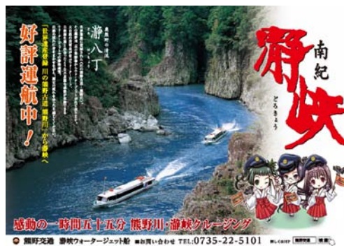
瀧峡ポスター（イメージ）